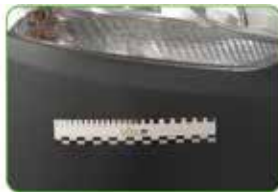
unlackierten Teilen unpainted parts