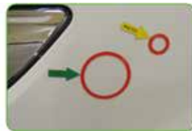
lackierten Teilen painted parts