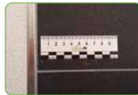
Fliesen und Spiegeln tiles and mirrors