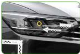
Glas und Kunststoffen glass and plastics