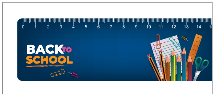
Vollflächiger Druck / All over printed