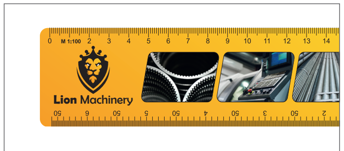
Vollflächiger Druck / All over printed