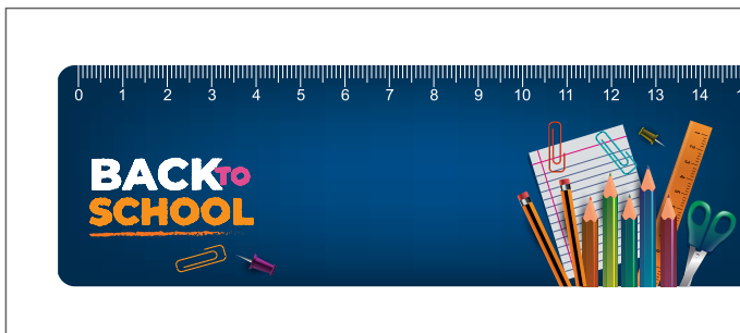
Vollflächiger Druck / All over printed